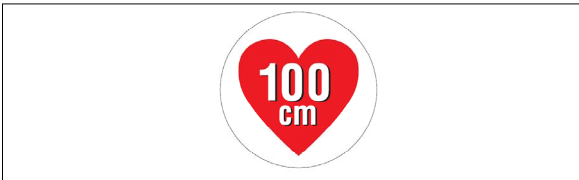
図2 据置きタイプRFID機器（高出力型950MHz帯パッシブタグシステム）用ステッカー

注1：ここでは、公共施設や商業区域などの一般環境下で使用されるRFID機器を対象としており、工場内など一般人が入ることができない管理区域でのみ使用されるRFID機器（管理区域専用RFID機器）については対象外としている。なお、管理区域専用RFID機器については、（一社）日本自動認識システム協会において、一般環境への流出を防止するため、取扱説明書等に注意書きを記載するとともに、管理区域専用RFID機器用ステッカー（図3）を貼付することとされている。