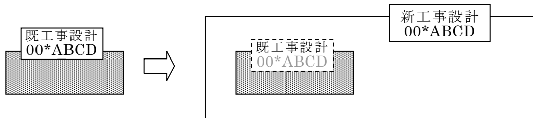
図1 「00*ABCD」は工事設計認証番号を示す

4.1.1 新工事設計が既工事設計のすべてを包含していること。包含のイメージは図1のとおり。