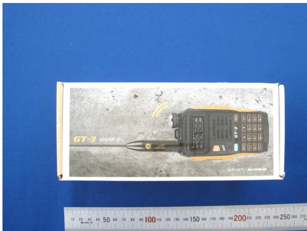
(ア) パッケージ (表面)