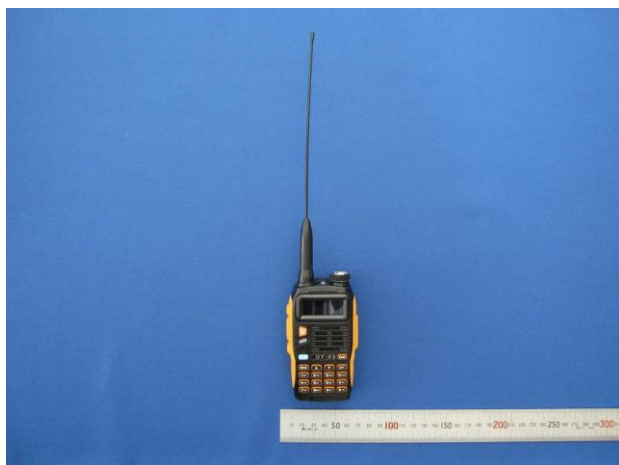
(ウ) 設備本体 (正面)