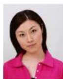
頭が左右に傾いているもの