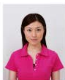
上三分身より小さいもの