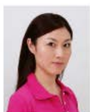
頭が横向きのもの