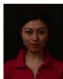
背景の色が濃く人物を特定できないもの