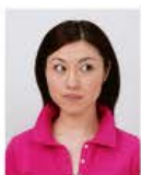
目線が正面でないもの