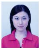
著しく変色しているもの