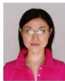
照明が眼鏡に反射したものの