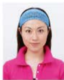
幅の広いヘアバンド等により頭部が隠れているもの