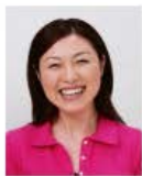
平常の顔貌と著しく異なるもの