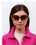
サングラスをかけているもの