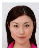
上三分身より大きいもの