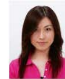
前髪が目元にかかっているもの