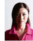
顔に影があるもの