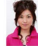
上部余白がないもの