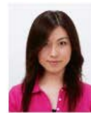
前髪が目元にかかっているもの