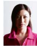
顔に影があるもの