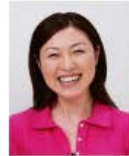
平常の顔容と著しく異なるもの