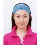
幅の広いヘアバンド等により頭部が隠れているもの