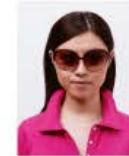
サングラスをかけているもの