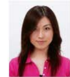
前髪が目元にかかっているもの