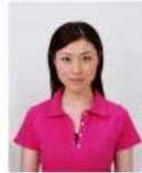
上三分身より小さいもの