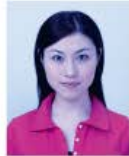
著しく変色しているもの