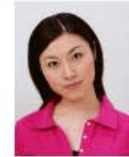
顔が左右に傾いているもの