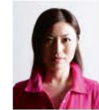
顔に影があるもの