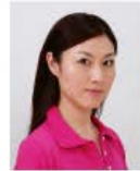
顔が横向きのもの