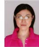
照明が眼鏡に反射したもの