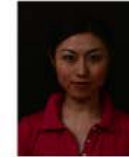
背景の色が濃く人物を特定できないもの