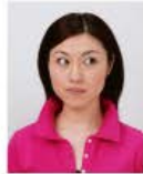
目線が正面でないもの