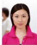
人物が写り込んでいるもの