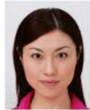
上三分身より大きいもの