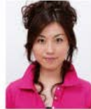
上部余白がないもの