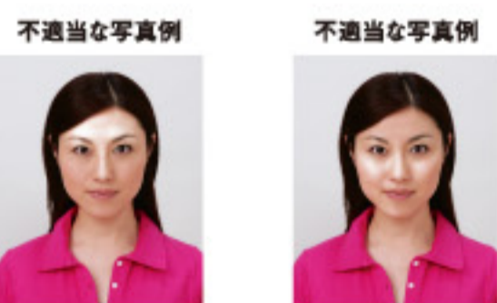
額に過度のテカリがあるもの 頬などに過度のテカリがあるもの

額、頬などに過度のテカリがあるものについては、免許証の写真が変色する可能性があるため不適当です。