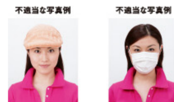
帽子によって頭部が隠れているもの マスクで顔の下半分が隠れているもの

サングラスやヘアバンド以外にも、顔の器官が隠れるような帽子や衣服、布などの大きめの装飾品等は不適当です。