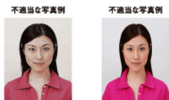
ノイズがあるもの 画像処理を施したもの

画像ファイルの過剰な圧縮等が原因となってノイズ（画像の乱れ）が発生しているもの、変形やマスキング（縁取り）などの画像処理を施したものは不適当です。