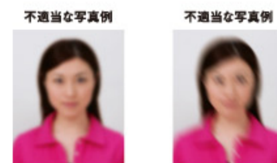
ピンぼけにより不鮮明なもの 手ぶれにより不鮮明なもの

撮影時にピントが合っていないかたり、手ぶれしてしまったために画像が不鮮明なものは不適当です。