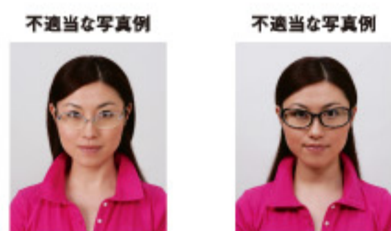
眼鏡のフレームが目にかかっているもの フレームが非常に太く目や顔を覆う面積が多いもの

眼鏡のフレームが目にかかっているものやフレームが非常に太いものなどは不適当です。