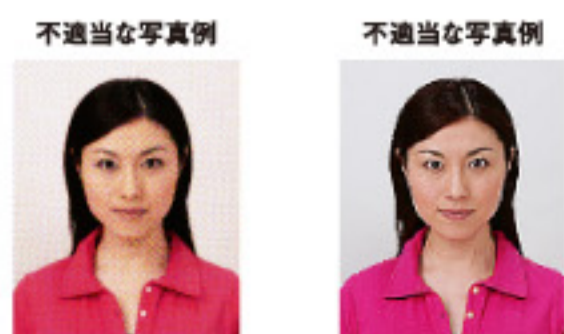
ドットやインクのにじみなどがあるもの ジャギーがあるもの

デジタル印刷の場合、ドット（網状の点）やジャギー（階段状のギザギザ模様）、インクのにじみなどがみられるものは不適当です。