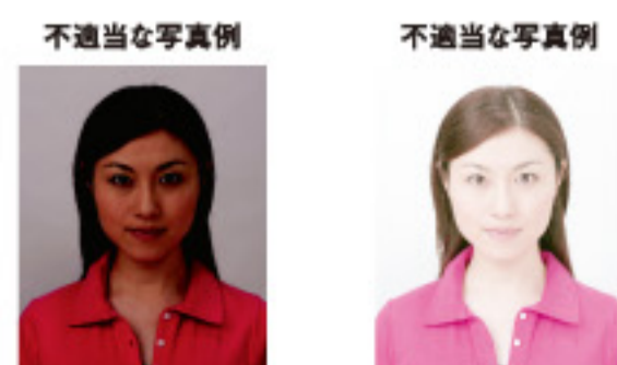
露出不足（露出アンダー） 露出過多（露出オーバー）

サングラスやヘアバンド以外にも、顔の器官が隠れるような帽子や衣服、布などの大きめの装飾品等は不適当です。