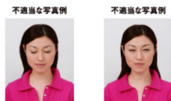
目をつぶっているもの 目をはっきりと開けていないもの

撮影時にピントが合っていないかたり、手ぶれしてしまったために画像が不鮮明なものは不適当です。