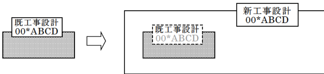
図1 「00*ABCD」は工事設計認証番号を示す

4.1.1 新工事設計が既工事設計のすべてを包含していること。包含のイメージは図1のとおり。