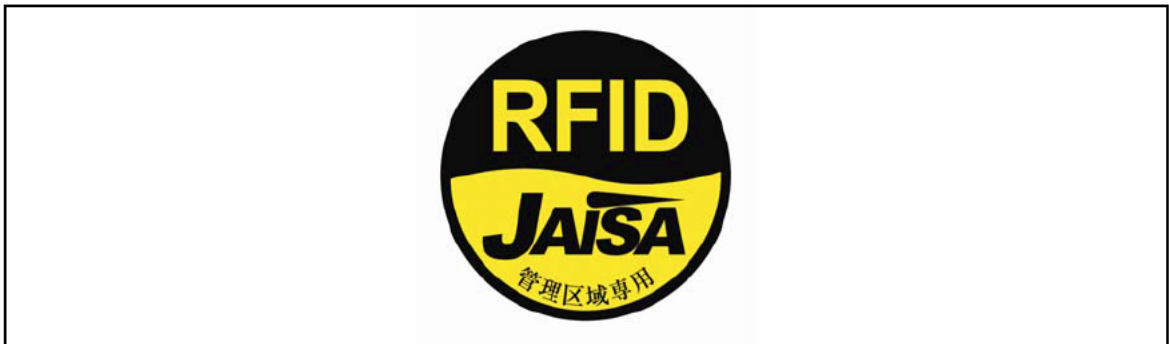
図3 管理区域専用RFID機器用ステッカ

注1： ここでは、公共施設や商業区域などの一般環境下で使用されるRFID機器を対象としており、工場内など一般人が入ることができない管理区域でのみ使用されるRFID機器（管理区域専用RFID機器）については対象外としている。なお、管理区域専用RFID機器については、（社）日本自動認識システム協会において、一般環境への流出を防止するため、取扱説明書等に注意書きを記載するとともに、管理区域専用RFID機器用ステッカ（図3）を貼付することとされている。