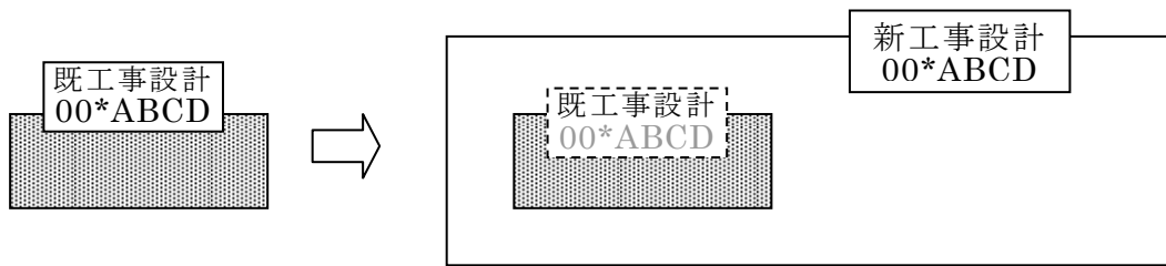
図1 「00*ABCD」は工事設計認証番号を示す

4.1.1 新工事設計が既工事設計のすべてを包含していること。包含のイメージは図1のとおり。