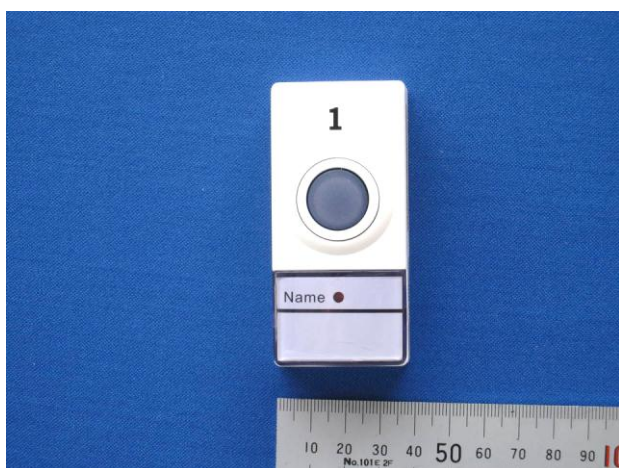
(ウ) 設備本体 (正面)