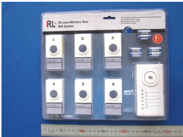
(ア) パッケージ (表面)