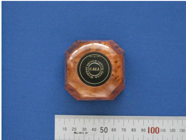
(ア) 設備本体 (正面)