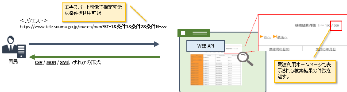
図 2-1 件数取得 API

件数取得 API は、検索条件を指定してリクエストを送信することで、指定した検索条件に当てはまる無線局の免許情報(または登録情報)の件数を取得することができます。電波利用ホームページの「無線局等情報検索 - エキスパート検索」で検索条件を指定して得られる無線局の件数と同等です。