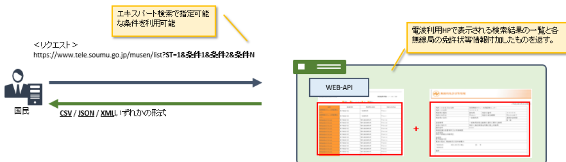
図 3-1 一覧取得 API

一覧取得 API は、検索条件を指定してリクエストを送信することで、指定した検索条件に当てはまる無線局の一覧と各無線局の免許情報(または登録情報)を取得することができます。電波利用ホームページの「無線局等情報検索 - エキスパート検索」で検索条件を指定して得られる無線局の情報と同等です。