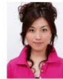
上部余白がないもの