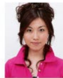
上部余白がないもの