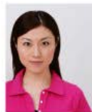
頭が左右に寄っているもの