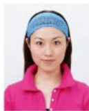
幅の広いヘアバンド等により頭部が隠れているもの