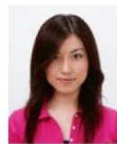
前髪が目元にかかっているもの