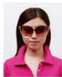
サングラスをかけているもの