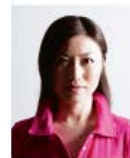
顔に影があるもの