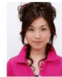
上部余白がないもの