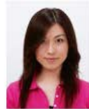
前髪が目元にかかっているもの