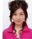
上部余白がないもの