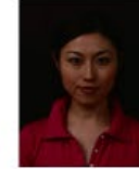
背景の色が濃く人物を特定できないもの