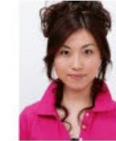
上部余白がないもの