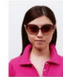
サングラスをかけているもの