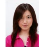
前髪が目元にかかっているもの