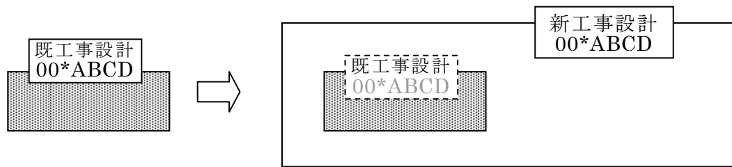
図1 「00*ABCD」は工事設計認証番号を示す

4.1.1 新工事設計が既工事設計のすべてを包含していること。包含のイメージは図1のとおり。